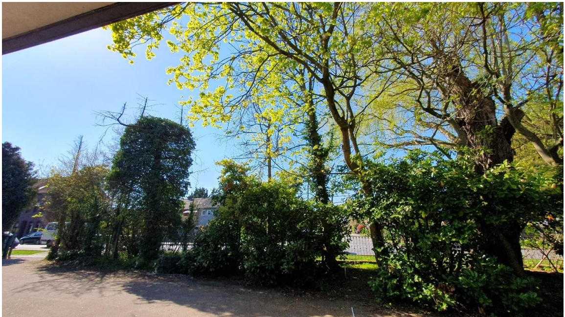
Abbildung 4: Baumbestand an der Rheinstraße (April 2023) (Architekturbüro Dalman, 2023)