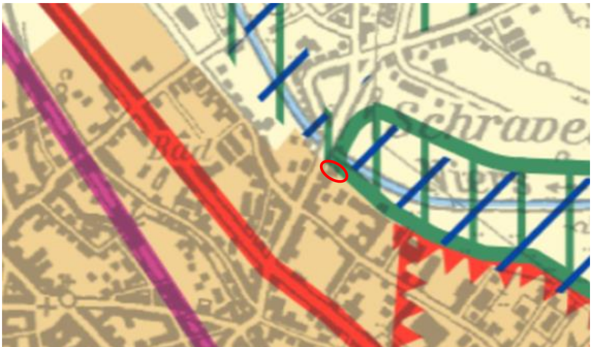
Abbildung 2: Auszug Regionalplan Düsseldorf (o. M.)

Natur- und landschaftsbezogene planerische Vorgaben werden für die verfahrensgegenständliche Fläche nicht getroffen. Die Planung folgt somit den Festlegungen des Regionalplans.