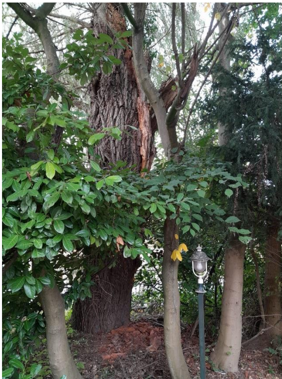
Abbildung 5: Marode Weide an der Rheinstraße, entnommen im Oktober 2023 (Architekturbüro Dalman, 2023)