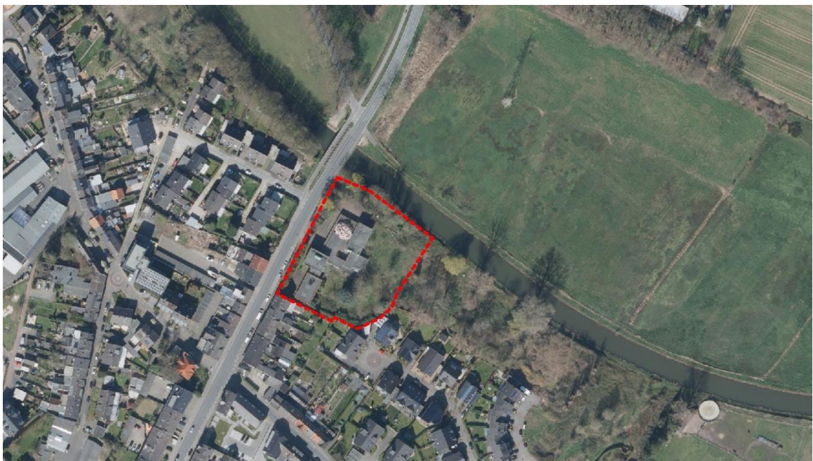
Abbildung 1: Luftbild mit Abgrenzung des räumlichen Geltungsbereichs des Bebauungsplans (rot gestrichelte Linie), ohne Maßstab

Jenseits der Niers sind zahlreiche landwirtschaftlich genutzte Flächen vorhanden. Die östlich des Plangebiets liegende Fläche wird im Flächennutzungsplan als „Flächen für Maßnahmen zum Schutz, zur Pflege und zur Entwicklung von Boden, Natur und Landschaft“ dargestellt und ist von der Planung des Vorhabens nicht betroffen.